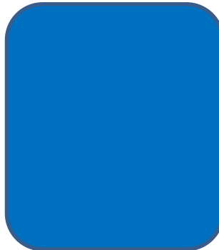
Block 7: Vacant