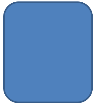
Block 4: Vacant